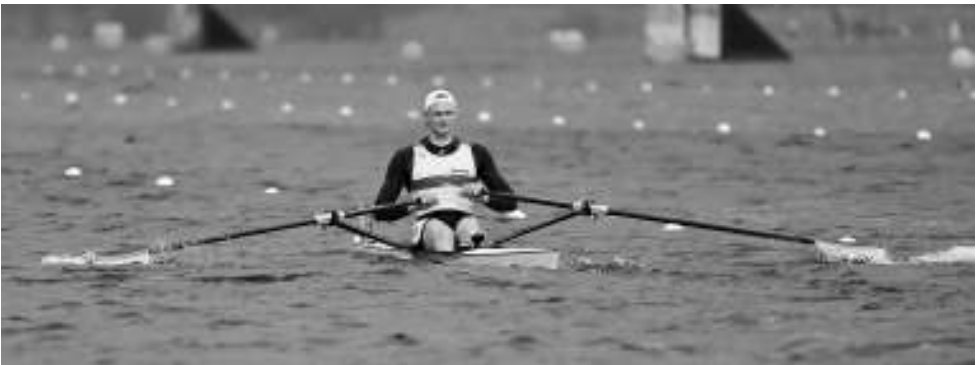
Oliver Zeidler Ruder- Europameister 2021 im Einer